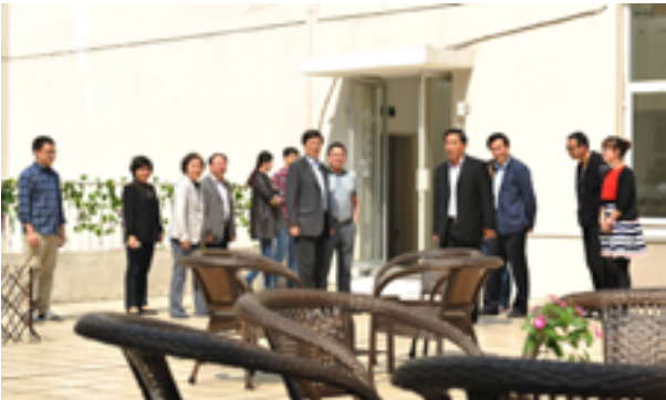
李维安校长及班子成员参观英语角

英语角活动自今年 5 月开办以来，得到院领导的高度重视。高院长、刘院长以及天津财经大学本部的李维安校长先后来到图书馆英语角参观并给予了肯定。