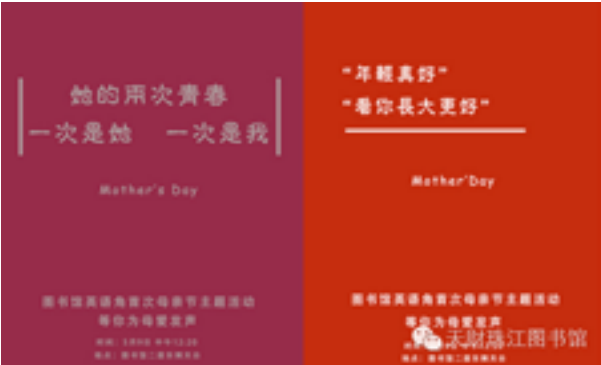
母亲节主题活动海报

适逢英语角活动在母亲节前夕正式开展，所以英语角的第一次活动的主题确立为“母亲节专题”。